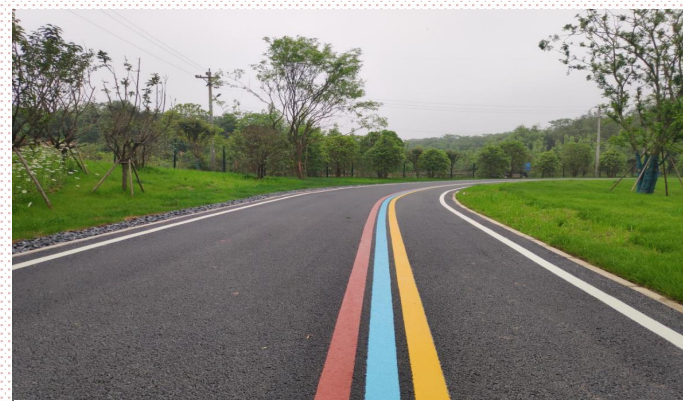
图为大洲湖绿道B段项目工程